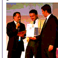
La premiazione della Lindbergh di Pescarolo (A pagina 6)

Lo smaltimento rifiuti è on line Per la Lindbergh premio allo Smau