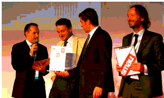
Lindbergh spa ha vinto il premio Innovazione Digitale allo Smau 2015

Se sottoposti a specifici trattamenti, molti elementi componenti anche i rifiuti più semplici (quali vetro, plastica e gomma) possono inoltre essere recuperati e riutilizzati per la creazione di altre apparecchiature. Grazie ad una politica di lancio aggressiva (solo 50 per 50kg di rifiuti da smaltire) e ad un servizio speciale di triturazione documentale nel rispetto e tutela della privacy,